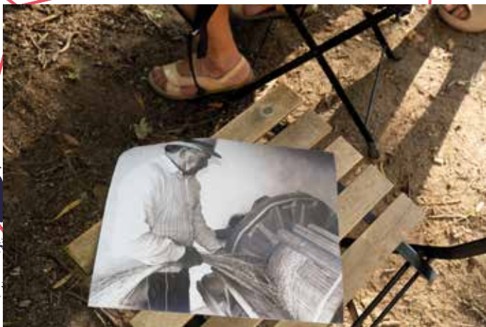
IMAGEM A PRETO E BRANCO CEDIDA PELO ARQUIVO DE ANTONIO AZEVEDO